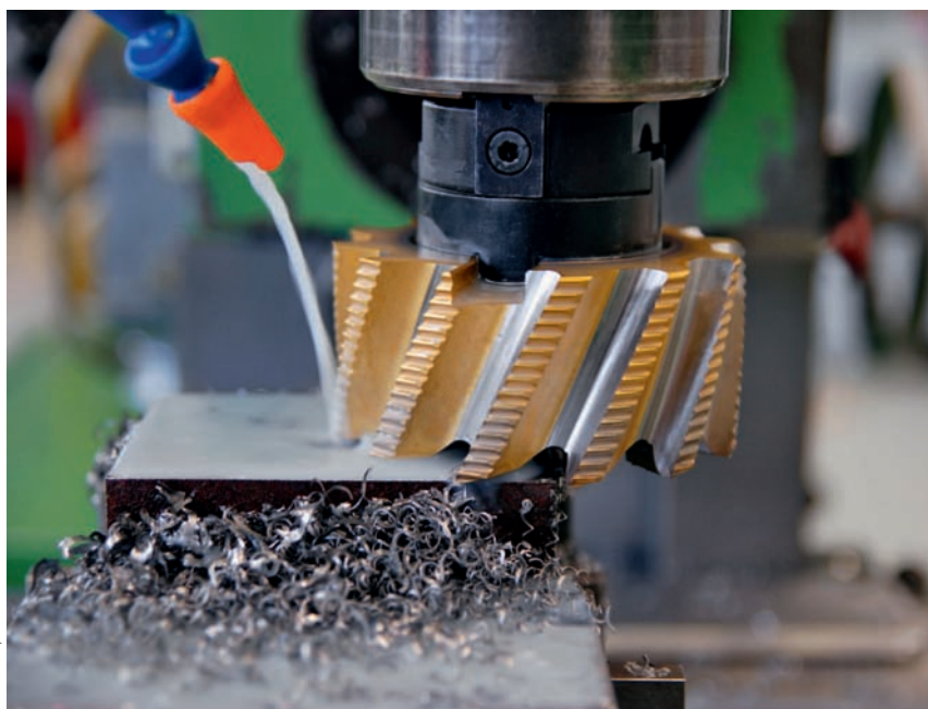
La productivité dans l'industrie MEM devrait continuer à progresser.

En ce qui concerne la mondialisation, il est particulièrement important pour les PME d'exploiter de nouveaux marchés pour réduire leur dépendance en tant que sous-traitants locaux. Dans le champ d'action Personnel qualifié, leur position est également plus difficile que