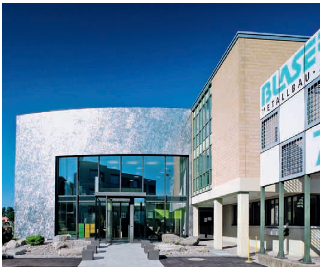
L'entreprise Blaser à Andelfingen est aujourd'hui spécialisée dans tout ce qui combine acier et verre.