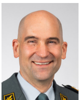
Korpskommandant Thomas Süssli Chef der Armee

Der Präsident des Schweizerischen Arbeitgeberverbandes und ich freuen uns auf einen intensiven Dialog mit Ihnen.